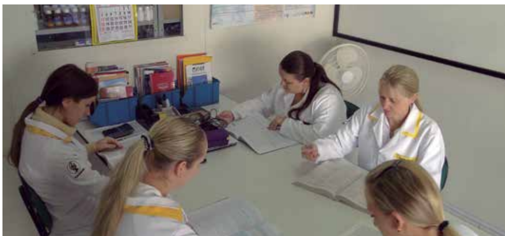
A criação da Farmácia-Escola e as atividades realizadas por estudantes de Farmácia e professores melhoraram o atendimento à população que necessita dos serviços públicos de saúde