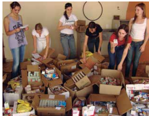
Campanha de recolhimento de medicamentos arrecadou, em seis anos, mais de 1 milhão de unidades. Os medicamentos recolhidos foram encaminhados ao descarte correto

e estudantes promovem, anualmente, uma campanha de arrecadação de medicamentos que os usuários armazenam em casa. De 2006 a 2013 foram arrecadados mais de 1 milhão de medicamentos (unidades), que foram encaminhados para o descarte adequado.