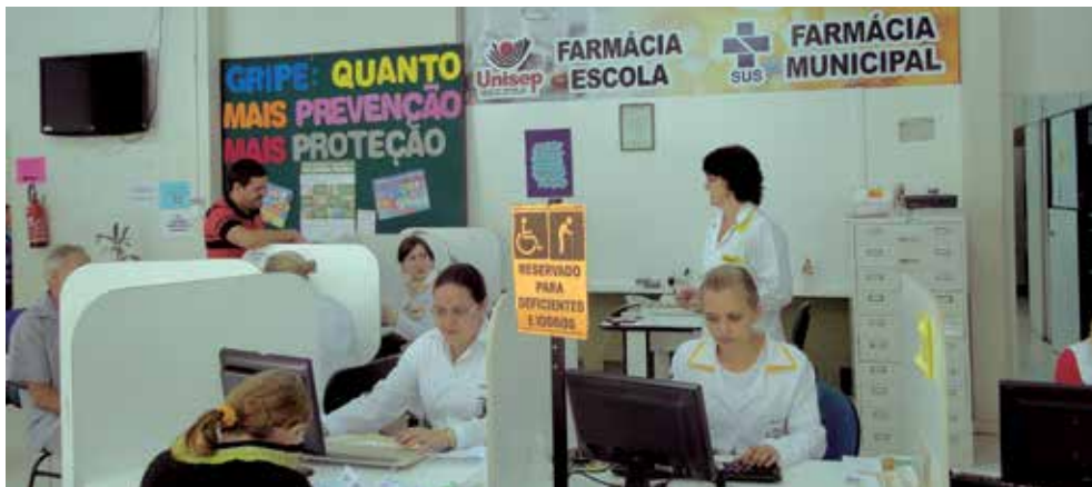
Professores e estudantes realizam, em média, 400 atendimentos diários, na Farmácia-Escola de Dois Vizinhos (PR)

O atendimento é feito respeitando a ordem de chegada, com senha. Ao serem chamados, os pacientes são recebidos por estudantes do curso de Farmácia, devidamente treinados e supervisionados por um professor com conhecimento em serviços farmacêuticos e dispensação de medicamentos.