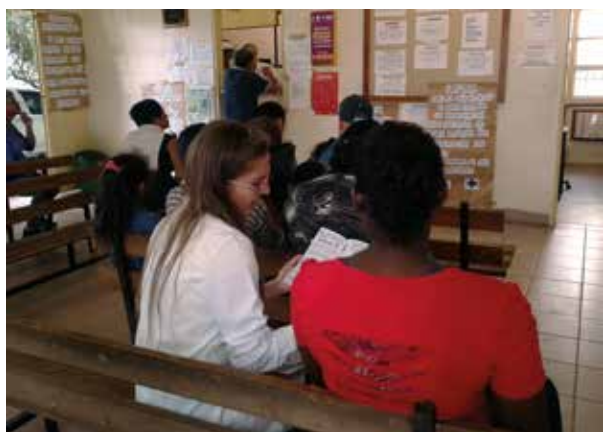
Atendimento em sala de espera de unidade de Saúde

A atenção básica em saúde caracteriza-se por um conjunto de ações que preconizam a promoção e a proteção da saúde, a prevenção de agravos, o diagnóstico, o tratamento, a reabilitação e a manutenção da saúde (BRASIL, 2012). Entretanto, apesar das políticas públicas e dos esforços relacionados, a assistência ainda baseada na lógica prescritiva e verticalizada acaba restrita aos consultórios, inutilizando os demais espaços disponíveis no serviço e na comunidade como ponto terapêutico, com vistas à educação em saúde.