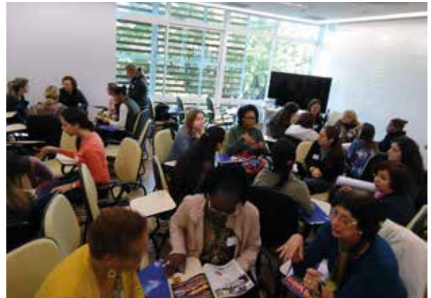
Oficina de Formação de Agentes Comunitários de Saúde

Os assuntos discutidos e utilizados como norteadores das oficinas de formação de ACS, basearam-se em situações corriqueiras na atuação destes profissionais, que favorecem a utilização inadequada de medicamentos e de plantas medicinais utilizadas como recursos terapêuticos.