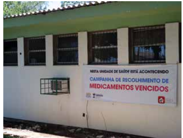
Divulgação da campanha de recolhimento de medicamentos vencidos em Unidade de Saúde

problema ambiental devido aos contaminantes oriundos desses resíduos.