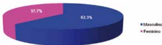
Figura 1: Distribuição dos pacientes internados no HUPA nos meses de maio a julho de 2007, conforme sexo

Observou-se que 499 (62,3%) prontuários analisados pertencem a crianças do sexo masculino, e 302 (37,7%) ao sexo feminino, conforme demonstrado na Figura 1.